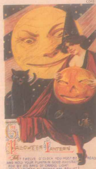
Immaginario. Strega, gatto nero, luna: è Halloween nella cartolina di Samuel Schmucker

Chi s'indignasse a causa di tale affermazione è pregato di riflettere sul ruolo che nella caccia alle streghe ebbe un grande giurista e teorico della politica del Cinquecento: Jean Bodin,