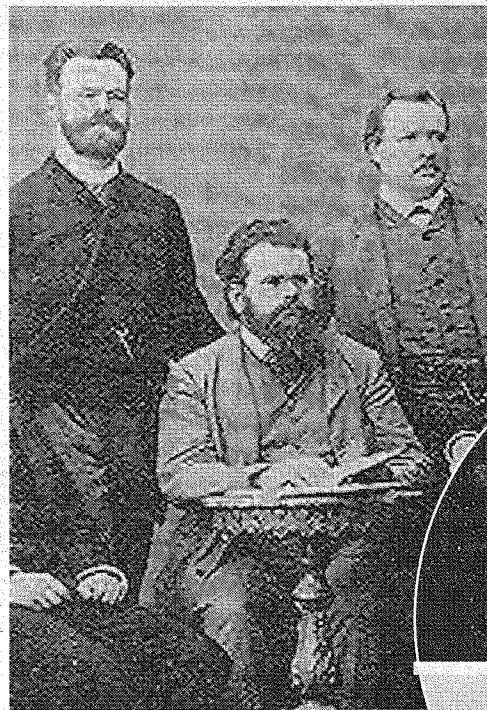
A VIENNA Boltzmann (al centro) con i colleghi Streintz e Arrhenius

Resta uno dei fisici più legati all'attualità: le applicazioni scientifiche e tecnologiche dell'equazione che porta il suo nome sono molteplici, dagli impieghi in termodinamica all'astrofisica, dai fenomeni gassosi riguardanti il corpo umano allo studio dell'inquinamento, via via sino alla progettazione di reattori nucleari, camere di combustione, semiconduttori. Anche un gas che sembra essere «macroscopicamente» a riposo, dopo Boltzmann sappiamo che ha frenesie di attività molecolari in forma di collisioni,